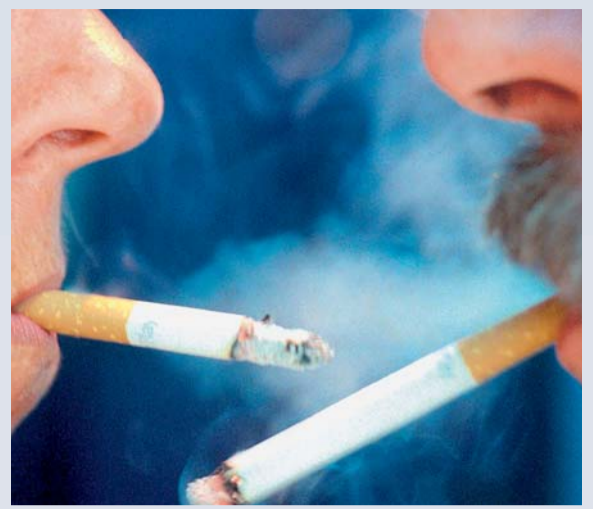
Abschieds-Zigarette? Oder vielleicht doch lieber noch nicht?